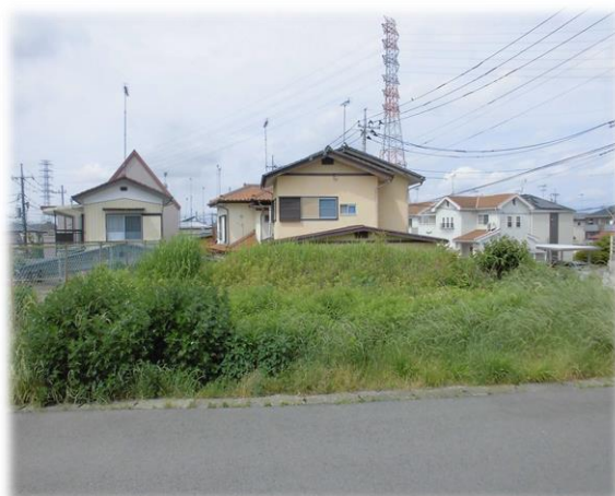
東側前面道路含む現地土地 ※街並み含む 掲載写真 2023年7月撮影